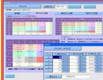
RFM分析 顧客動向の把握

日々移り変わる状況をいち早くキャッチ！顧客の囲い込みを具現化するためお手伝いさせていただきます！