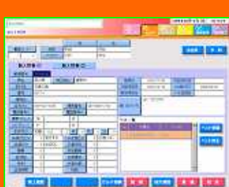
多頭飼いの管理も可能

飼い主・ペット別にカルテを電子化。施術履歴や画像での管理も可能。手書きカルテも標準装備。