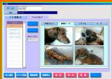
画像管理でビジュアル化