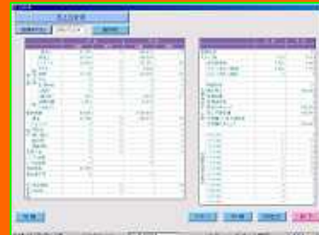
帳票一例 (売上日計表)