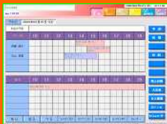
予約状況の明確化！

予約も楽々管理！グラフ上で顧客名・犬名・担当者を確認。ホテル管理機能も搭載！レジとして使用することも可能です！